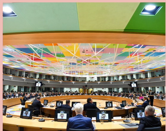
Sala de reuniones del Edificio Europa (Bruselas), sede del Consejo de la UE y del Consejo Europeo